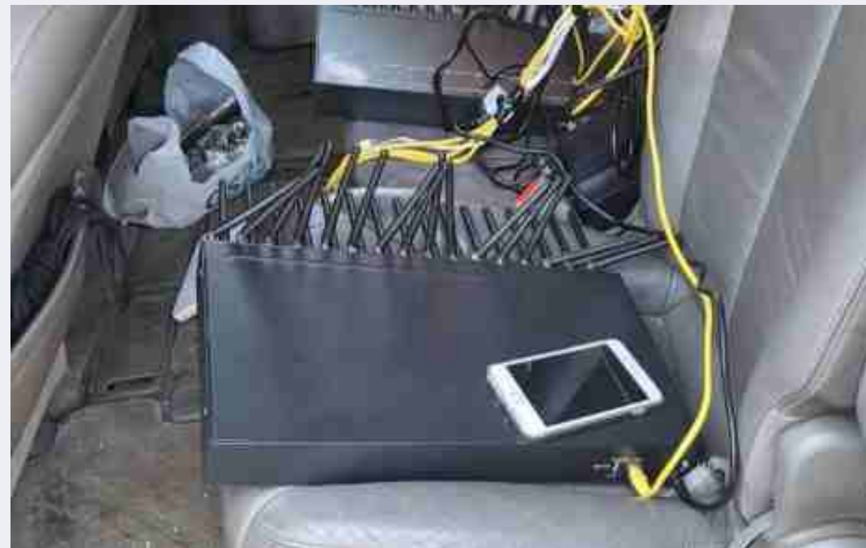
VoIP 중계기 방식