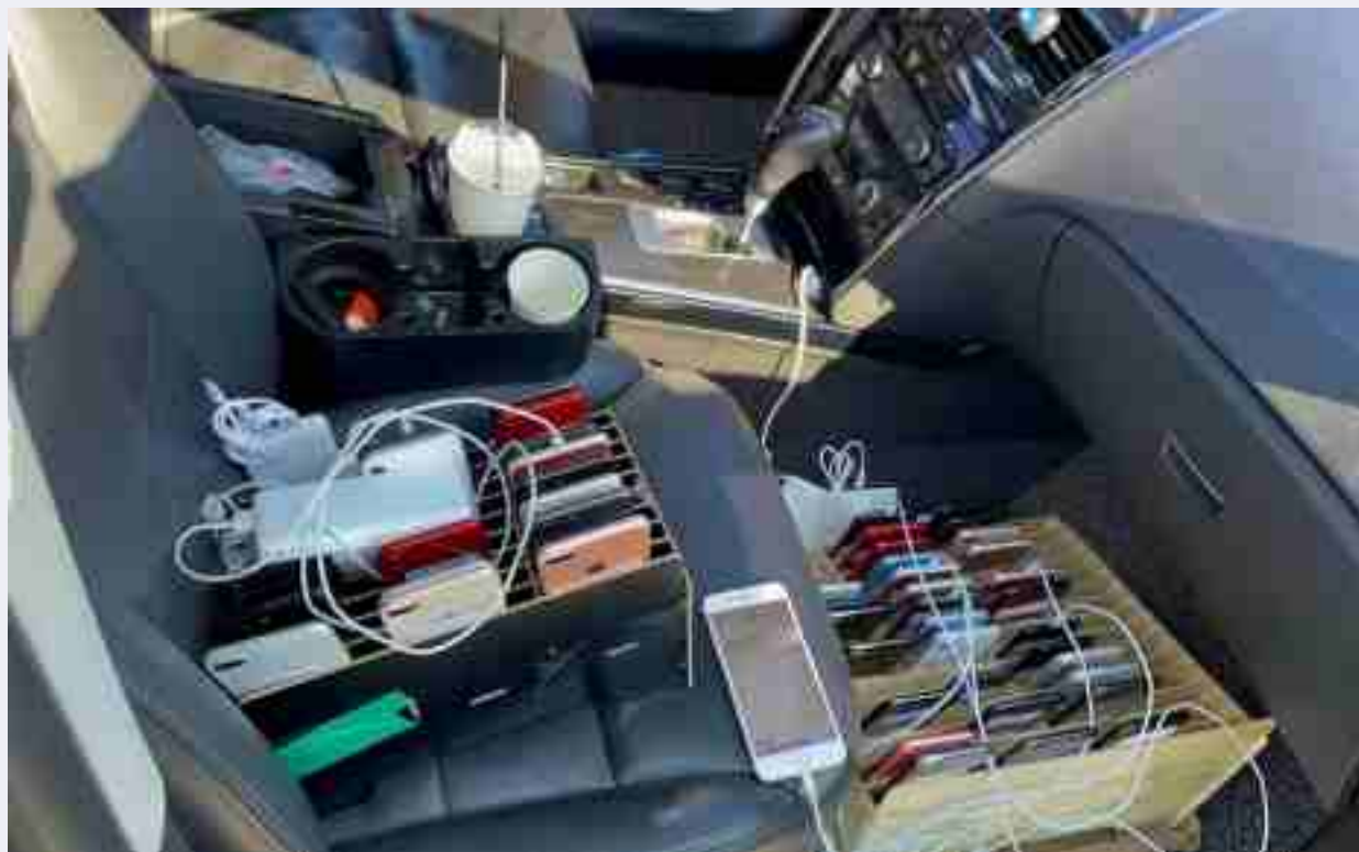
VPN 페어링 방식